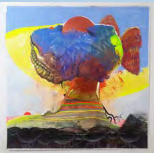
Robel Temesgen: Adbar, 2018 – Acrylic, ink, permanent marker, tape, tippex, and ink pen on paper, 110 x 110cm. Courtesy of the artist and Dawit Abebe

Seine Bilder entführen in Räume, die von spiritueller Bedeutung durchdrungen sind. Nach umfangreichen Recherchen in Äthiopien bemüht er sich, durch einen phänomenologischen Ansatz die gelebte Erfahrung von Landschaft im Kontext des äthiopischen Glaubens des Adbar und der damit verbundenen Rituale darzustellen.