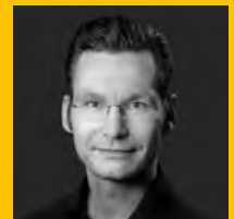
Roman Starke Fotograf, Mediengestalter